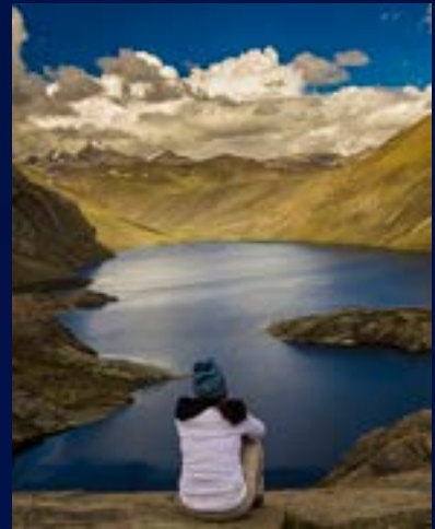
Referencia fotografía de paisaje.