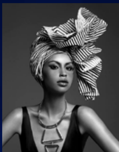
Referencia fotografía de moda.