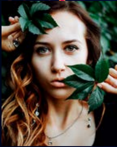
Referencia fotografía de retrato..