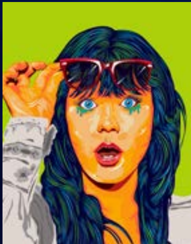
Referencia de ilustración digital retrato.