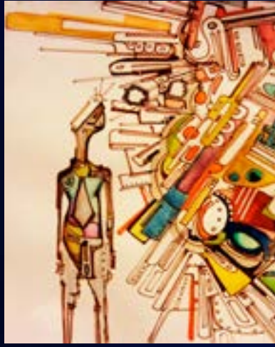
Referencia de ilustración tradicional conceptual.