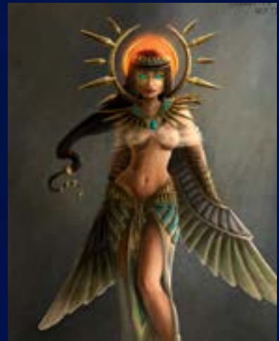
Referencia de ilustración digital personaje.