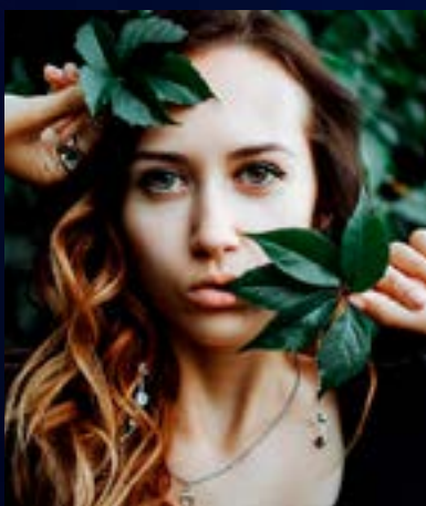
Referencia fotografía de retrato.