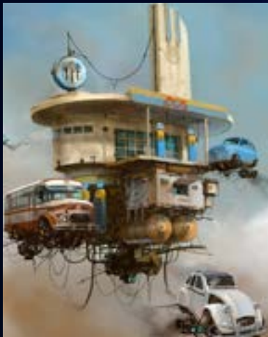
Referencia de ilustración digital conceptual.