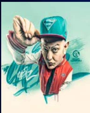
Referencia de ilustración digital.