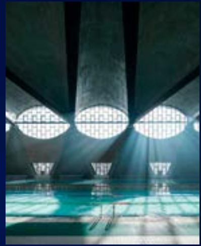
Referencia fotografía arquitectónica.