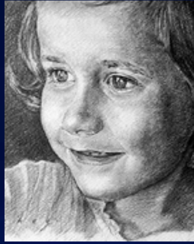
Referencia de ilustración tradicional de retrato.