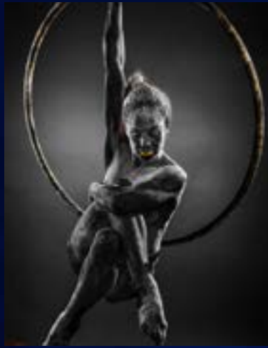
Referencia fotografía conceptual.