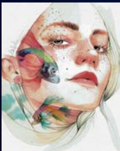
Referencia de ilustración tradicional.