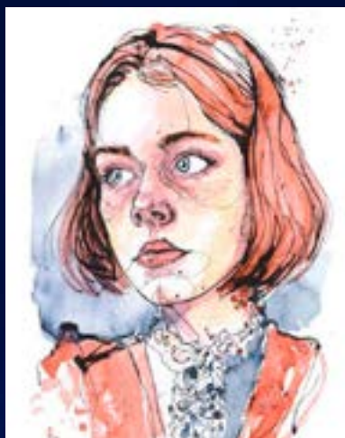
Referencia de ilustración tradicional.