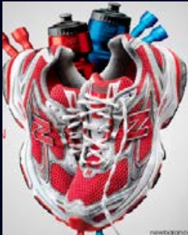
Referencia fotografía publicitaria.