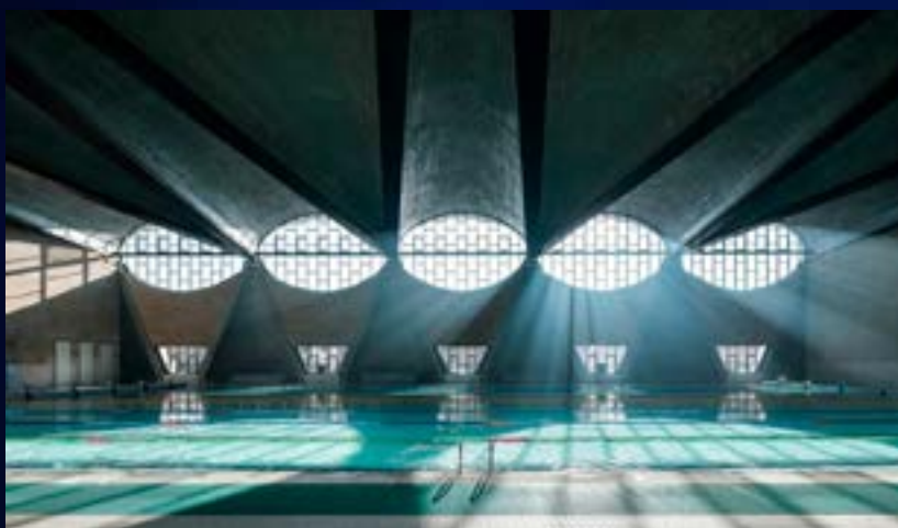
Referencia fotografía arquitectónica.